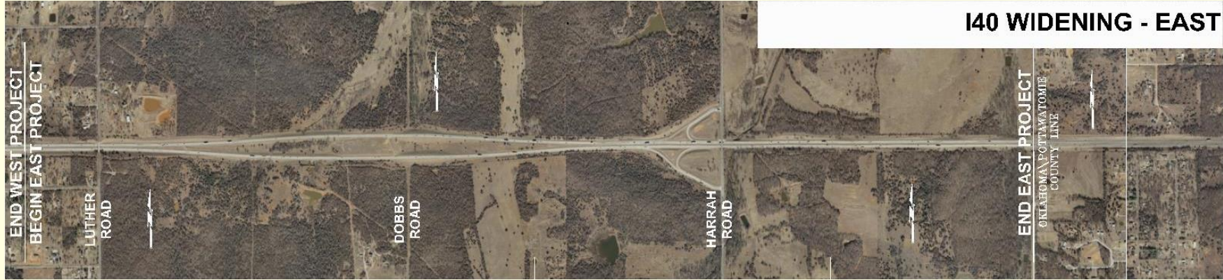
140 WIDENING - EAST