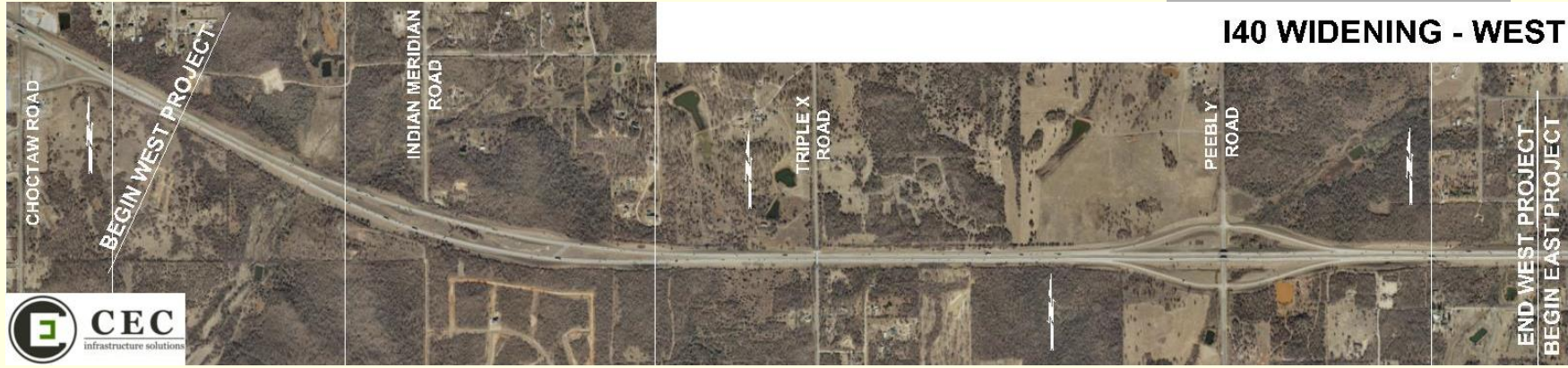
140 WIDENING - WEST