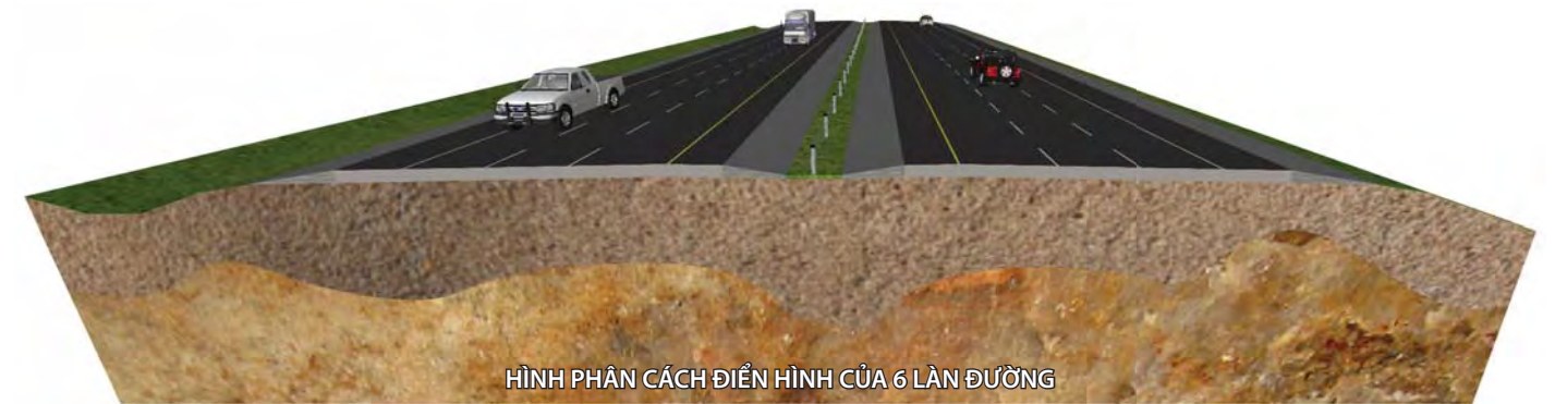
HÌNH PHÂN CÁCH ĐIỂN HÌNH CỦA 6 LÀN ĐƯỜNG

Sở Giao Thông Oklahoma (ODOT) đã hợp tác với Ban Quản lý Đường Xa lộ Liên bang (FHWA) để đưa ra các đề xuất cải thiện Đường Xa lộ Liên bang 40 từ dặm 167 đến 173. Đường I-40 hiện tại qua đoạn đường này có tình trạng vỉa hè xấu, các cây cầu đã cũ và kết cấu lỏng lẻo, và khả năng thông xe chưa đáp ứng được nhu cầu giao thông hiện tại và trong tương lai. Gần đây ODOT đã thuê tuyển một Tư vấn để phát triển đồ án thi công nhằm cải thiện Đường I-40 mà vẫn tính đến chi phí xây dựng, các yêu cầu về lộ giới và hạn chế về môi trường.